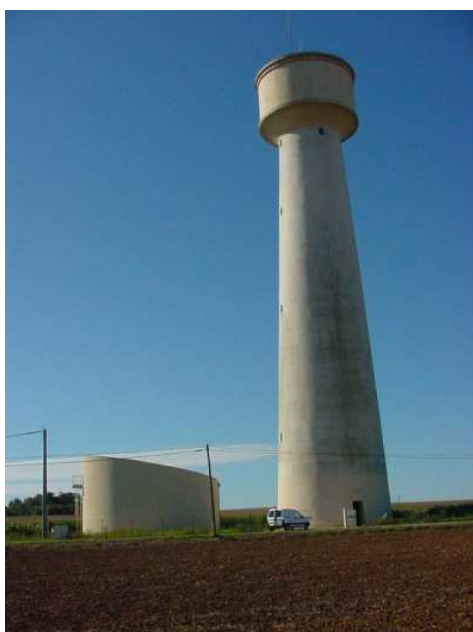
Château d'eau de Bonnes

Compte tenu des différents approvisionnements en eau, il a été défini 2 UDI (unités A et B ci-dessous).