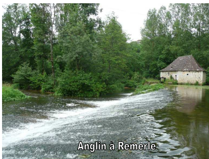
Anglin à Remerle

La procédure administrative est terminée pour les 3 captages de Mon Plaisir , Remerle et des Vignaux .